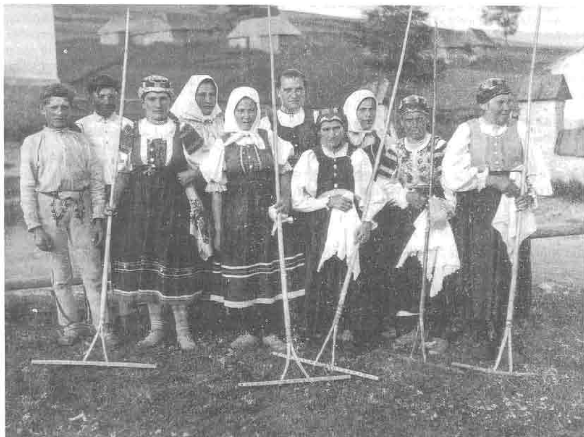
Hrabáčky v Ždiari, okr. Poprad. 20. roky.

zesse, deren Beginn wir etwa an das Ende des 19. und den Anfang des 20. Jahrhunderts datieren können, beginnen sich in der Umwelt des slowakischen Dorfes nach dem Krieg ausgeprägter bemerkbar zu machen. Die Auswahl der einzelnen Haustypen ist nicht mehr so sehr durch den Einfluß der Tradition oder durch Erfordernisse der Funktion bedingt, sondern vor allem durch die Mode und durch das Bedürfnis nach gesellschaftlicher Repräsentation. In der Nachkriegszeit wird das Wohnhaus in der ländlichen Umwelt als Symbol des Besitzes und der gesellschaftlichen Position betrachtet.